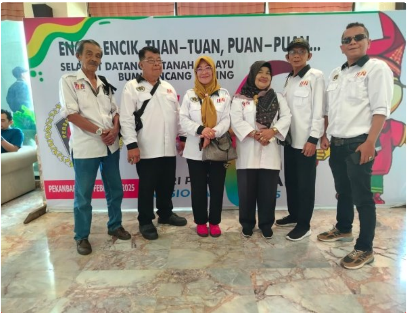
Enam Delegasi PWI Bukittinggi Turut Meriahkan Puncak HPN 2025

Pekanbaru – Acara puncak Hari Pers Nasional (HPN) 2025 dengan tema Pers Berintegritas Menuju Indonesia Emas berlangsung megah di Grand Ballroom Mutiara Merdeka, Kota Pekanbaru, Riau, Minggu 9 Februari 2025